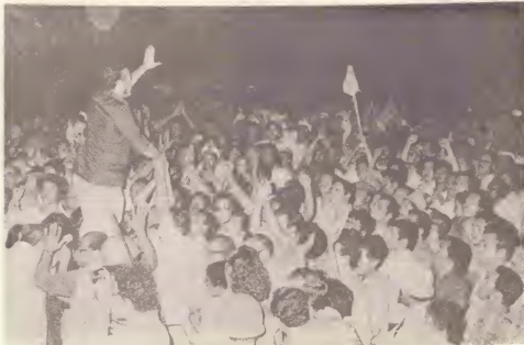
Sr. Betico Croes calmando e pueblo durante Augustus 1977.